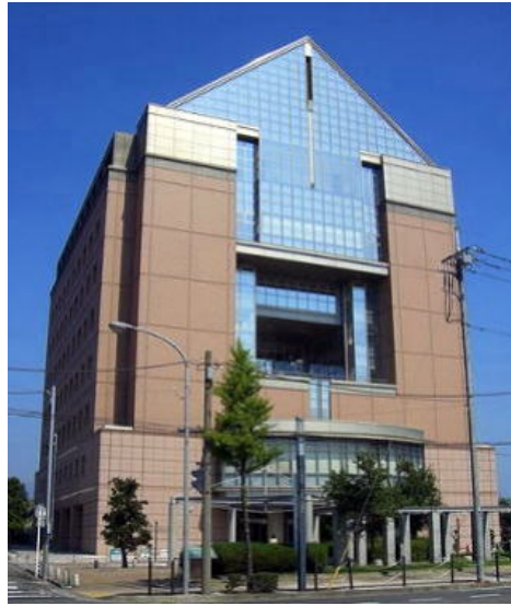
図1 群馬県社会福祉総合センターの概観